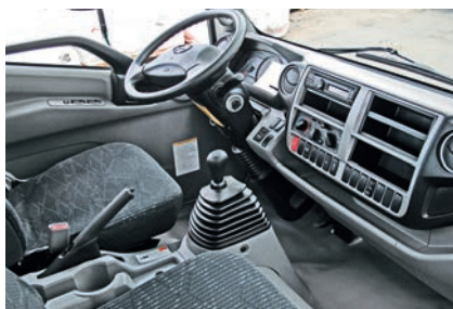
С механической коробкой можно «сложить» рычаги стояночного тормоза и КП