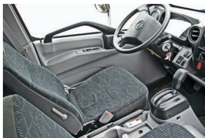
Селектор АКП смонтирован там же, где стоял рычаг механической КП