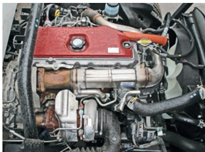
Привод ГРМ на этом двигателе – шестернями переднего расположения