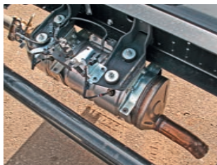
Система нейтрализации EGR дополнена сажевым фильтром. Так что это не простой глушитель из нержавеющей стали

Hino уровня Евро-3 и выше оснащаются электронно-управляемой топливной системой Common Rail. Турбина GT22 фирмы Honeywell тоже современная, с электронно-регулируемым направляющим аппаратом. Моторы Hino N04C Евро-4, с которыми «трехсотку» поставляли в Россию в 2012 году, уже тогда оснащались системой EGR, то есть рециркуляцией отработавших газов, без впрыска в выпускную систему водного раствора мочевины AdBlue. Использовали известную технологию с охлаждением ОГ в особом водяном теплообменнике перед подачей во впускной трубопровод. Такая схема нейтрализации достаточно широко распространена на «среднетоннаж-