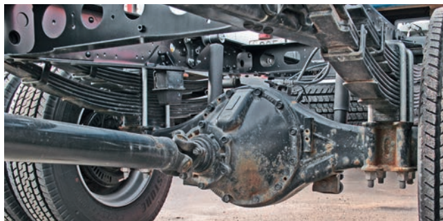
В гипоидном редукторе ведущего моста, в сравнении с механической КП, под «автомат» увеличили передаточное число