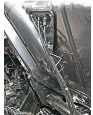
От селектора в кабине к са- мой автоматической коробке идут два троса управления

По передаточным числам у нее на первой передаче 3,74, на шестой 0,63. Прямая передача с i=1,0 здесь четвертая. Пятая – это первый овердрайв, а шестая – вторая повышающая. Если сравнивать первую передачу «автомата» 3,74 с числами механических коробок для HINO 300, то разница между 4,98 или 5,98, и, тем более, 6,37 – просто огромная. Но надо понимать, что в 2-2,5 раза эти числа в планетарных редукторах АКП повышает гидротрансформатор. Кроме того, есть отличия в передаточном числе главной передачи. На машинах с «автоматом» передаточное число редуктора ведущей оси увеличено – 5,857 (для автомобилей