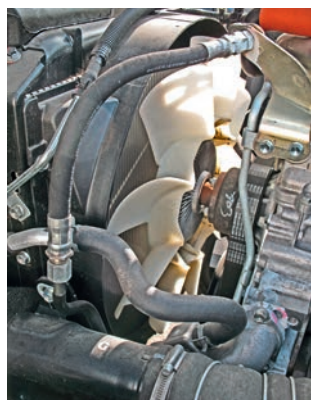
Привод вентилятора – надежным поликлиновым ремнем. Муфта вязкостная