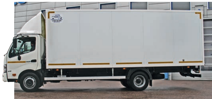
На шасси «трехсотки» с АКП нам показали изотермический фургон, но не менее перспективна надстройка-эвакуатор

Николай Мордовцев