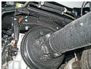
На вторичном валу смонтирован барабанный тормоз. Обслуживать его просто

В японском автопроме компания Aisin Seiki Co. Ltd все равно что ZF в Европе. Производит различные механические, роботизированные и автоматические коробки передач, сцепления, детали тормозных систем и двигателей, электрику и электронику. Один из акционеров компании – концерн Toyota. AISIN Group – ведущий производитель комплектующих не только для японских, корейских автозаводов, но и европейских, а также американских. В ее составе 11 заводов, расположенных в разных странах мира.