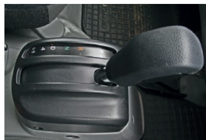
На селекторе есть режимы ограничения: не выше 3 и не выше 4 передачи

масляного насоса. Причины перегрева: проблемы с жидкостью, неисправность или загрязнение теплообменника АКП, долгая езда с высокой нагрузкой на низших передачах, долгое буксование автомобиля.