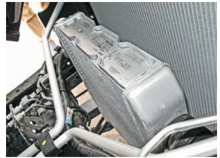
Это интеркулер, а теплообменник АКП вмонтирован в основной радиатор