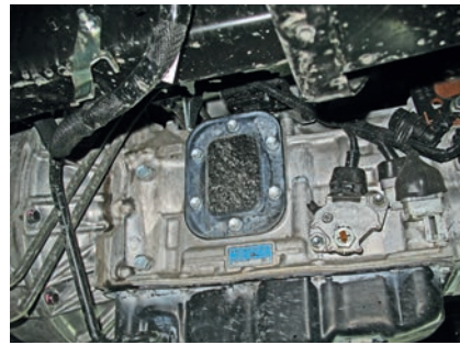
С левой стороны АКП есть лючок для монтажа коробки отбора мощности