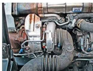
Турбина фирмы Honeywell с электроннорегулируемым направляющим аппаратом

никах». Двигатели экологического класса Евро-5 тоже оснащены системой EGR, но рециркуляция дополнена сажевым фильтром.