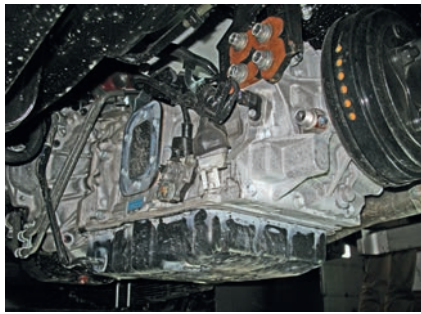
Коробка A860E рассчитана на момент 420 Н·м, почти как для ЗИЛ-130