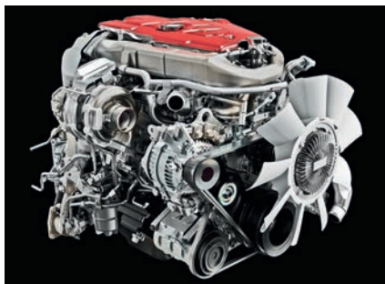
Hino N04C один из немногих небольших дизелей с «сухими» гильзами